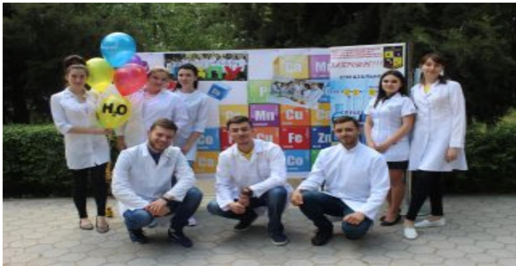
Студенти факультету під час тижня хімії