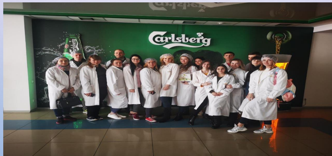
ЗАПОРІЗЬКИЙ ПИВОВАРНІЙ ЗАВОД CARLSBERG