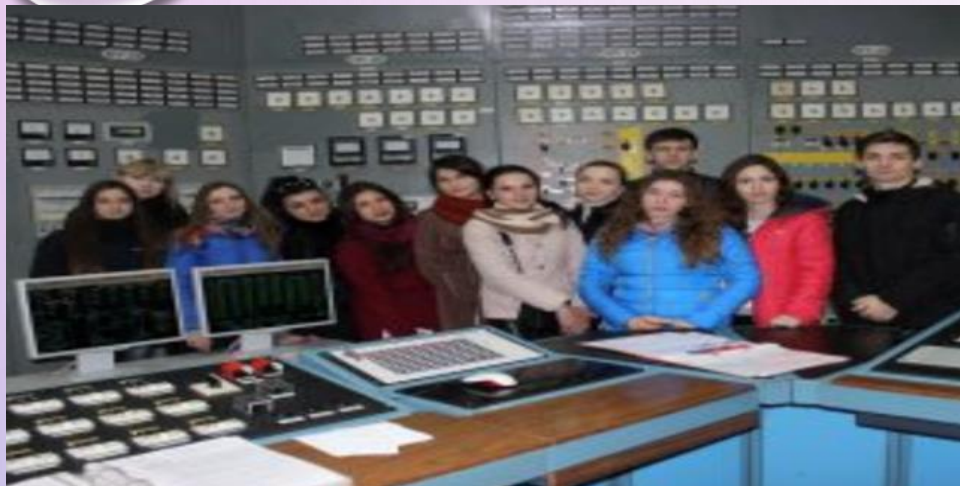
ПРАКТИКА СТУДЕНТІВ НА ЗАПОРІЗЬКІЙ АЕС