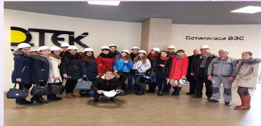
ПРАКТИКА СТУДЕНТІВ НА БОТІВЬКІЙ ВЕС